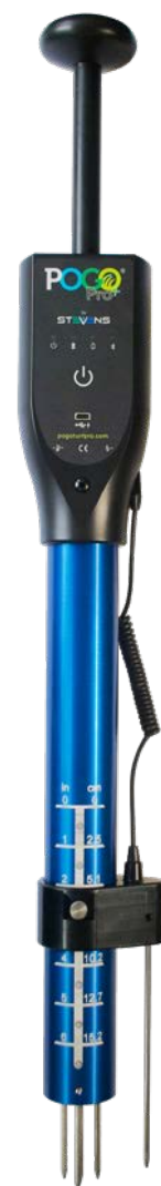
Sonda POGO Pro+

*È necessario disporre di un account POGO TurfPro Cloud attivo per connettersi.