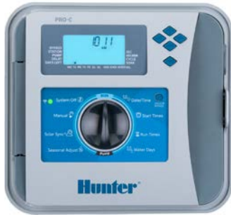
פלטטיק לשימוש בחוץ גובה: 22.9 ס"מ רוחב: 25.4 ס"מ עומק: 11.4 ס"מ

תכנות פשוט והרחבת ברזים גמישה הופכים את בקר ה-PRO-C לבחירה מקצועית עבור מערכות מגורים ופרויקטים מסחריים קלים.