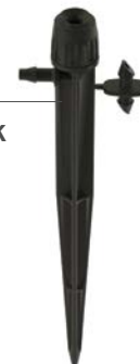
HS-B-STK Wysokość: 15,2 cm