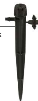
SD-B-STK Wysokość: 15,2 cm