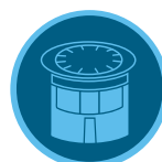
Ugelli per micro irrigatori a corto raggio

Per un sistema di irrigazione dall'alto più robusto, utilizza gli ugelli a corto raggio associati agli irrigatori Pro-Spray: