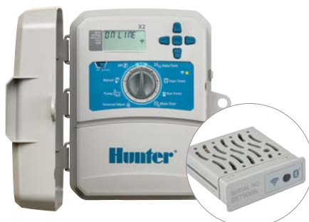
X2-Controller mit WAND-Modul Stationsanzahl 4, 6, 8 und 14