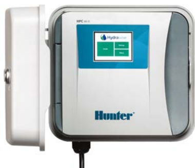
HPC-Steuergerät Stationsanzahl 4 bis 32, optional mit EZDS Decoder