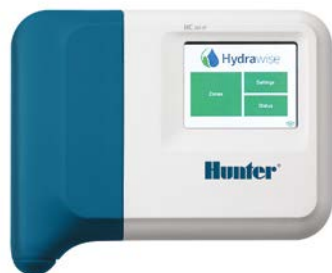
HC-Steuergerät Stationsanzahl 6 und 12

Anerkannt als Gerät zum verantwortungsbewussten Wasser sparen