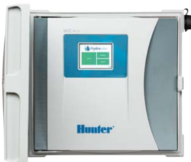
HCC-Steuergerät Stationsanzahl 8 bis 54, EZDS-Zweileiter-Option