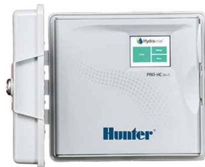
Pro-HC Steuergerät Stationsanzahl 6, 12 und 24