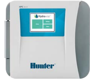
HPC Arayüz Paneli