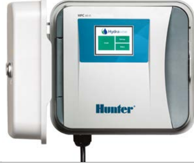
HPC (plastik iç/dış mekan) Yükseklik: 22,9 cm Genişlik: 25,4 cm Derinlik: 11,4 cm