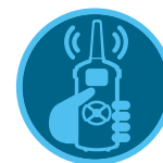
Télécommande ROAM Télécommande ROAM XL