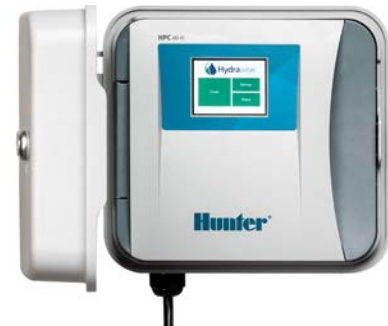
HPC (plastique intérieur/extérieur) Hauteur : 22,9 cm Largeur : 25,4 cm Profondeur : 11,4 cm