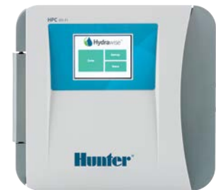
Panneau Avant HPC