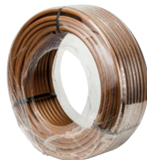
Cievky zabalené vo fólii