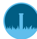
Eco-Indikátor 173. oldal