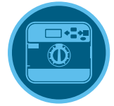
Pro-C Kontrol Ünitesi