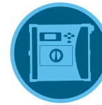
ICC2 Kontrol ünitesi