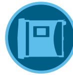
HCC Kontrol Ünitesi